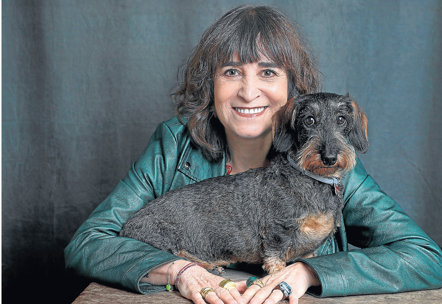
Rosa Montero, apasionada de los perros y las salamandras, hace unos días en Madrid, en la presentación de su nueva novela.

CIENCIA FICCIÓN ROSA MONTERO DESPIDE A SU MEJOR 'ALTER EGO' BRUNA HUSKY EN UNA NOVELA SOBRE LA IDENTIDAD